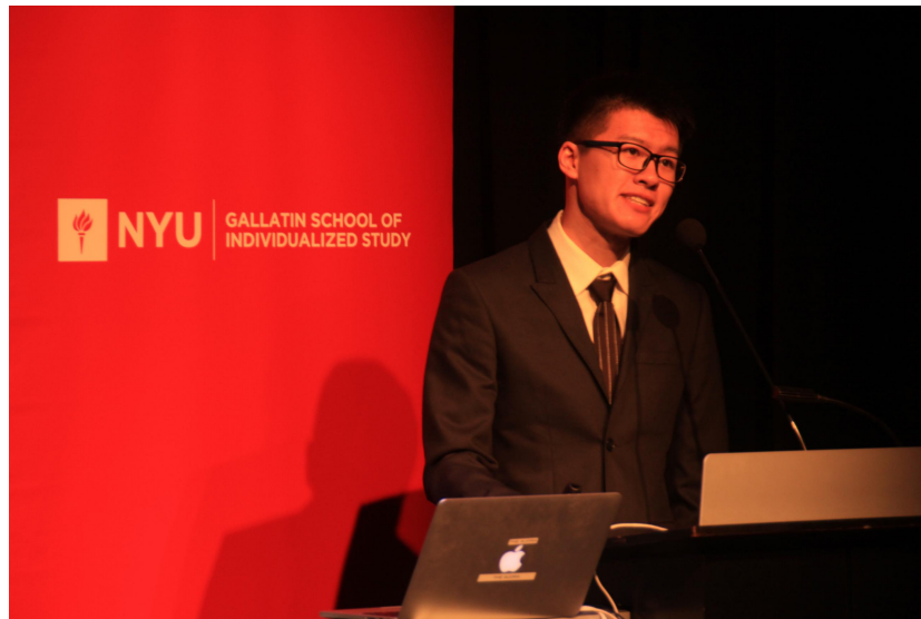
在纽约大学发表演讲