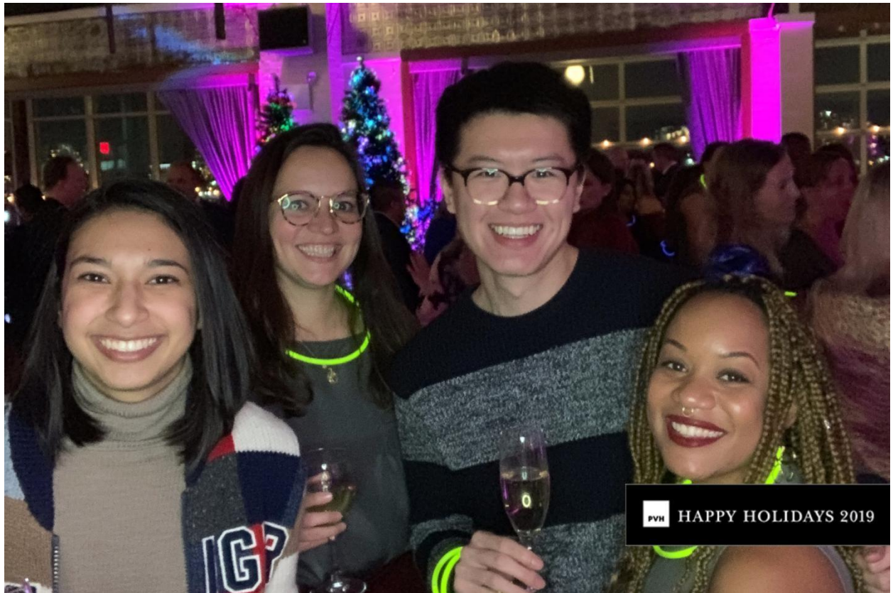
2019 年 PVH 纽约圣诞派对