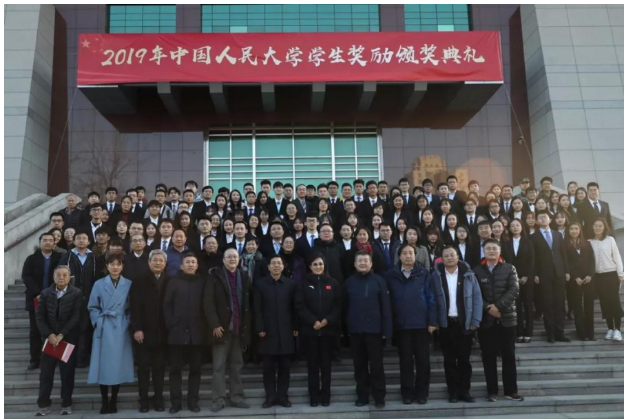
全体领导老师、颁奖嘉宾及获奖学生代表合影留念。

靳诺书记发表讲话。她首先向获得表彰的同学们送上祝贺、向潜心育人的老师们致以敬意、向到场为获奖同学送上鼓励的嘉宾表示感谢。她指出，中国人民大学不忘初心，牢记新时代高等教育的使命和责任，紧扣立德树人根本任务，健全三全育人体制机制，全面落实“以本为本”，回归“四个回归”，扎实推进双一流建设。她表示，在优秀校友和企业家的资助下，学校推出了几项特别的学生奖励，强化了学生奖励在价值引领、学业促进、素质提升、能力发展等方面的作用。她勉励同学们：用远大的理想抱负强筋壮骨，将自己的理想同国家的命运紧密联系；用过硬的本领才干摸爬滚打，努力获取广博见识，更好发挥个人价值；用可贵的精神品质滋养进补，学会明辨是非、弘扬向上精神、常怀感恩之心。她强调，希望同学们明白成绩代表过去，优秀贵在坚持。做到处优而不养尊，受挫而不短志，珍惜荣誉，奋勇投身新时代，在中华民族伟大复兴的历史发展中绘制自己的锦绣蓝图。